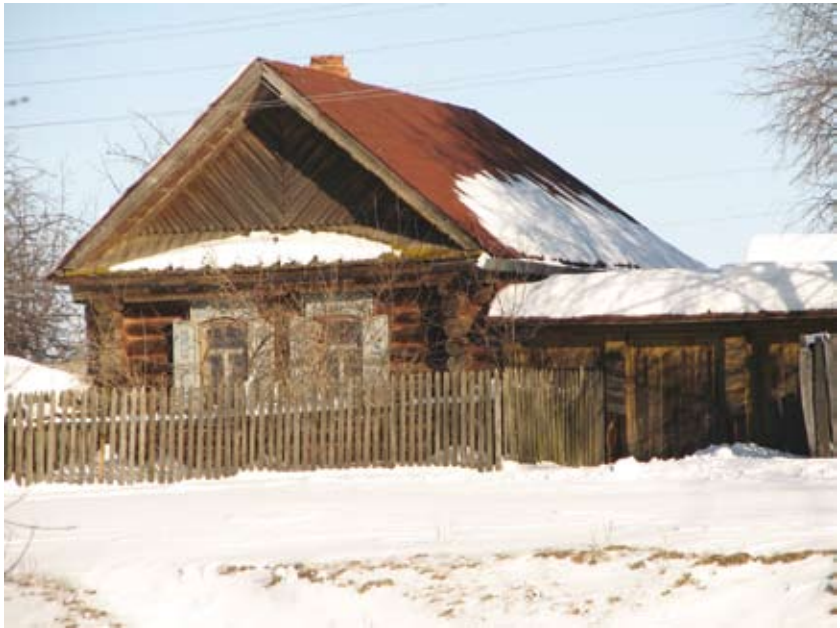
Дом, в котором служил и умер владыка Гурий