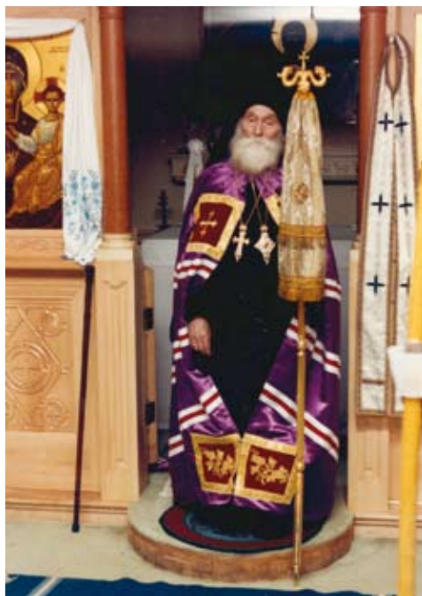
Епископ Гурий в мантии. 1991 год