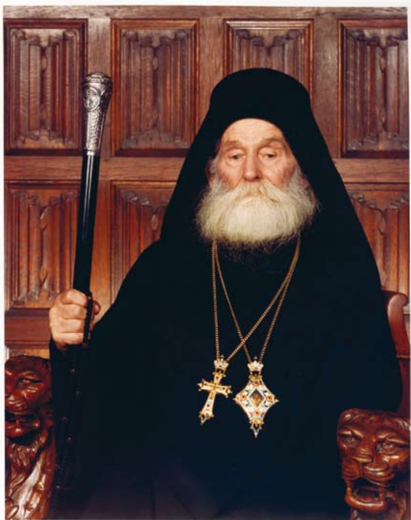
Епископ Гурий. 1991 год