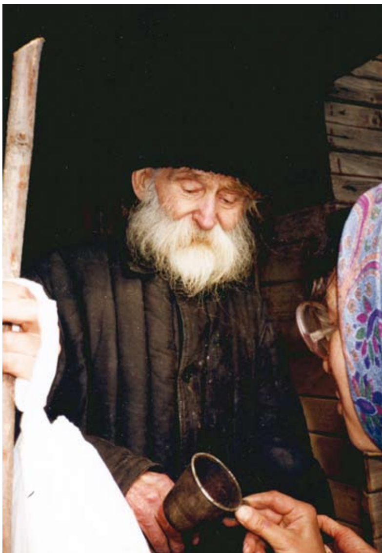
Владыка Гурий. Октябрь 1995 года (последняя прижизненная фотография)