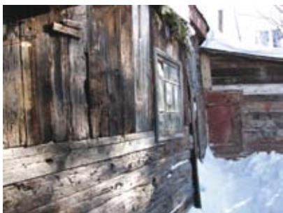
Внутренний дворик и сарайчик, где была тайная церковь