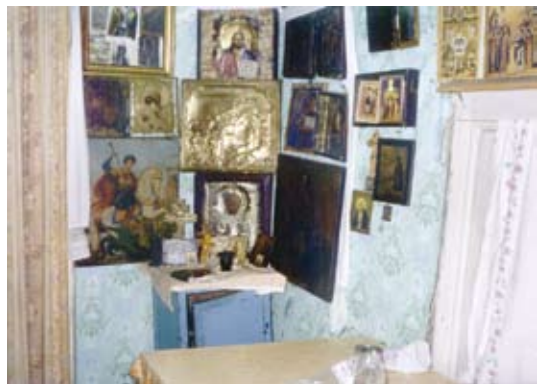
Васильево. Катакомбный монастырь