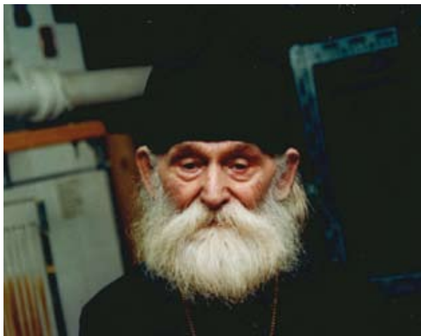
Епископ Гурий. 1991 год