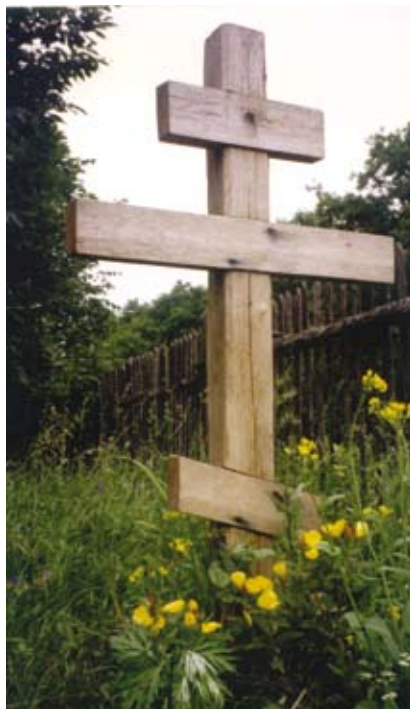
Могила владыки Гурия