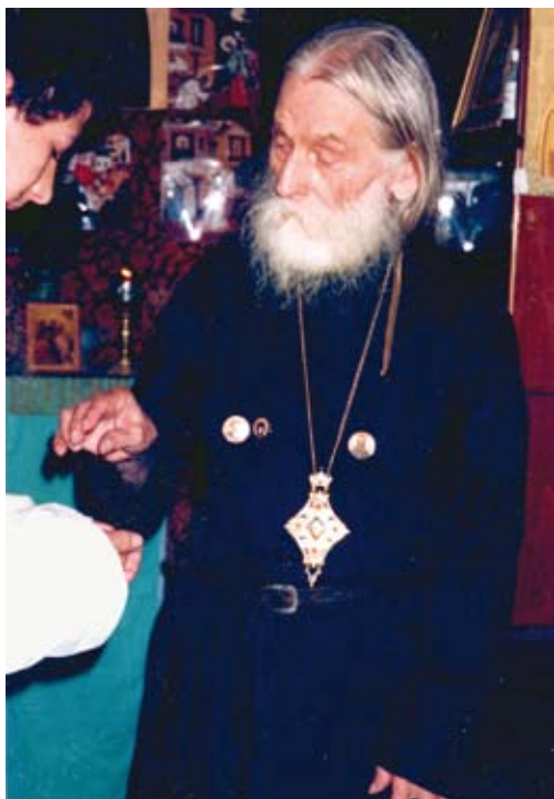
Владыка Гурий в России Июнь 1993 года, Москва