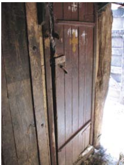
Вход в тайную церковь Казанской Божией Матери