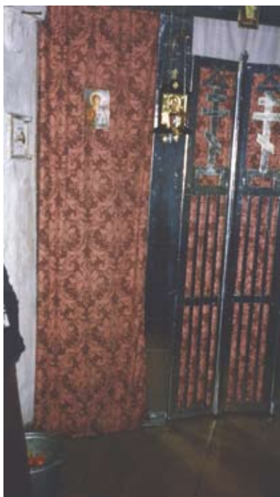
Тайная церковь Казанской Божией Матери