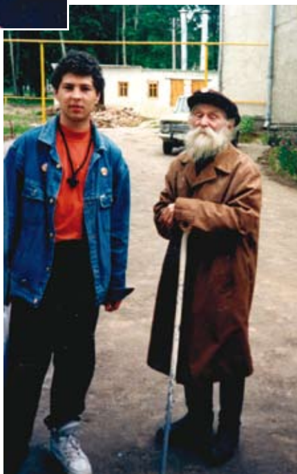
Владыка Гурий в России Июнь 1993 года, Дивеево