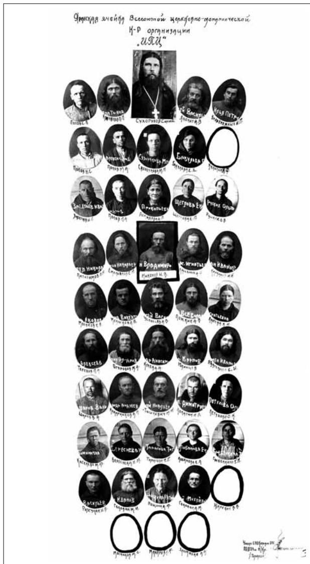
Обвиняемые из Яранского благочиния, обозначенного в следственном деле 1932 года как «филиал или ячейка Всесоюзной церковно-монархической контрреволюционной организации ИПЦ»