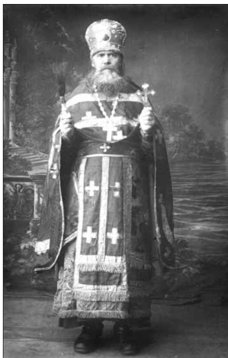
Архимандрит Варсонофий (Никитин)