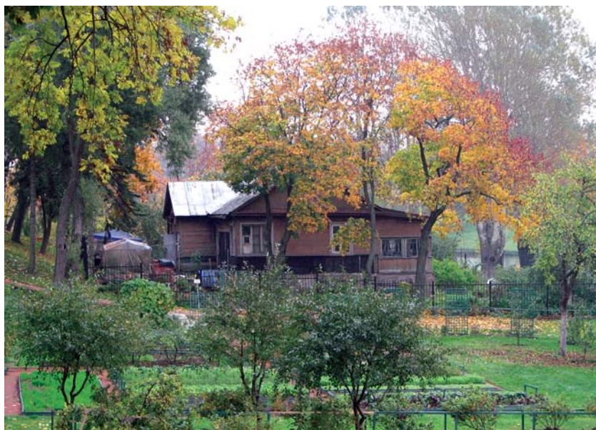
Стрельна. Дом у Церковной горки, построенный священномучеником Измаилом Рождественским