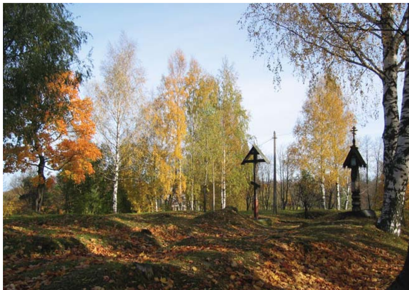
Стрельна. Церковная горка, место Свято-Преображенской церкви